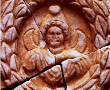
Kaynak Ünal Demirer, Pisidia Antiokheiası-Aziz Paulus, Men Kutsal Alanı ve Yalvaç Müzesi, Yalvaç Belediyesi Yayınları, 2003, s. 68.