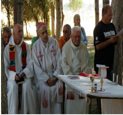
Resim 5a: St. Paul Kilisesinde Dini Tören