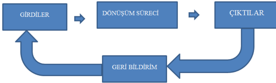
Şekil 1: Sistem Yaklaşımına Göre; Girdiler, Dönüşüm Süreci, Çıktılar

Optner (1960:9-11), sistem girdileri, girdilerin işlenmesi, sistemin çıktıları, iş sırasının kontrolü, sistemin yaşamasını sağlayan geri bildirim mekanizması olmak üzere sistemin beş ana unsurdan ibaret olduğunu belirtir. Şekil 1’de ki döngü tek bir örgüt için geçerli olabildiği gibi tüm sosyal sistemler için de geçerlidir. Bir işletme açık bir sistem olarak çevresinden para, makine, materyal, ve bilgi gibi girdileri temin ederek bu girdileri amaçları doğrultusunda birleştirir ve çıktıları elde eder. Sosyal sistemler de aynı şekilde belli amaçlar için oluşturulmuşlardır (Hodgets, 1997: 379-381).