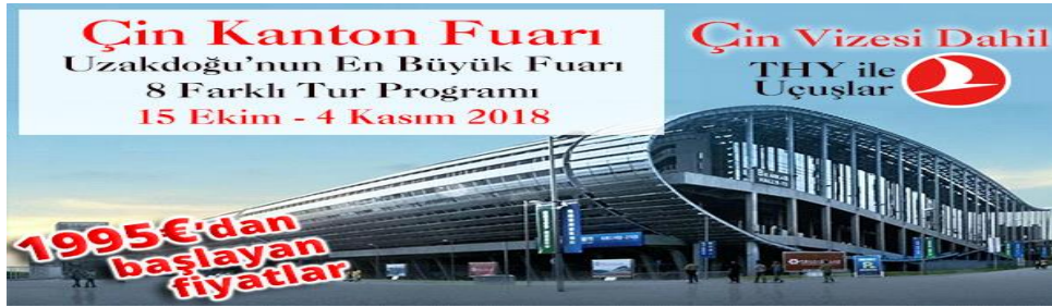
Şekil 3: Türkiye'den Çin Fuarlarına Seyahat Organizasyonu Örneği